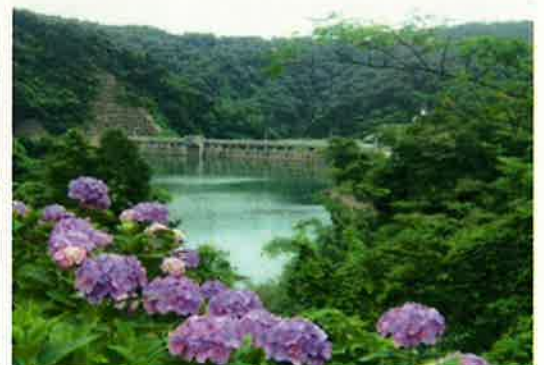
アジサイと正善寺湖