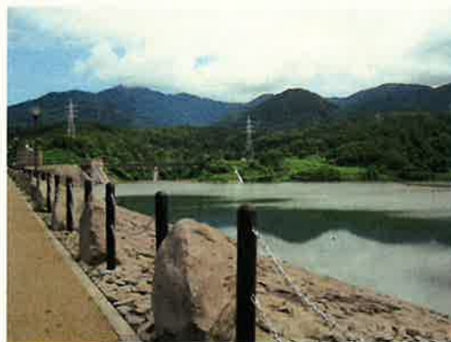
米山とかきざき湖