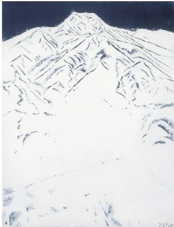
1. 増谷直樹《雪の日》 2. グループGUN《雪のイメージを変えるイベント》 3. 柴田長俊《道(久比岐野十二景)》 4. 富岡惣一郎《妙高山》 5. 岩野勇三《待合室》