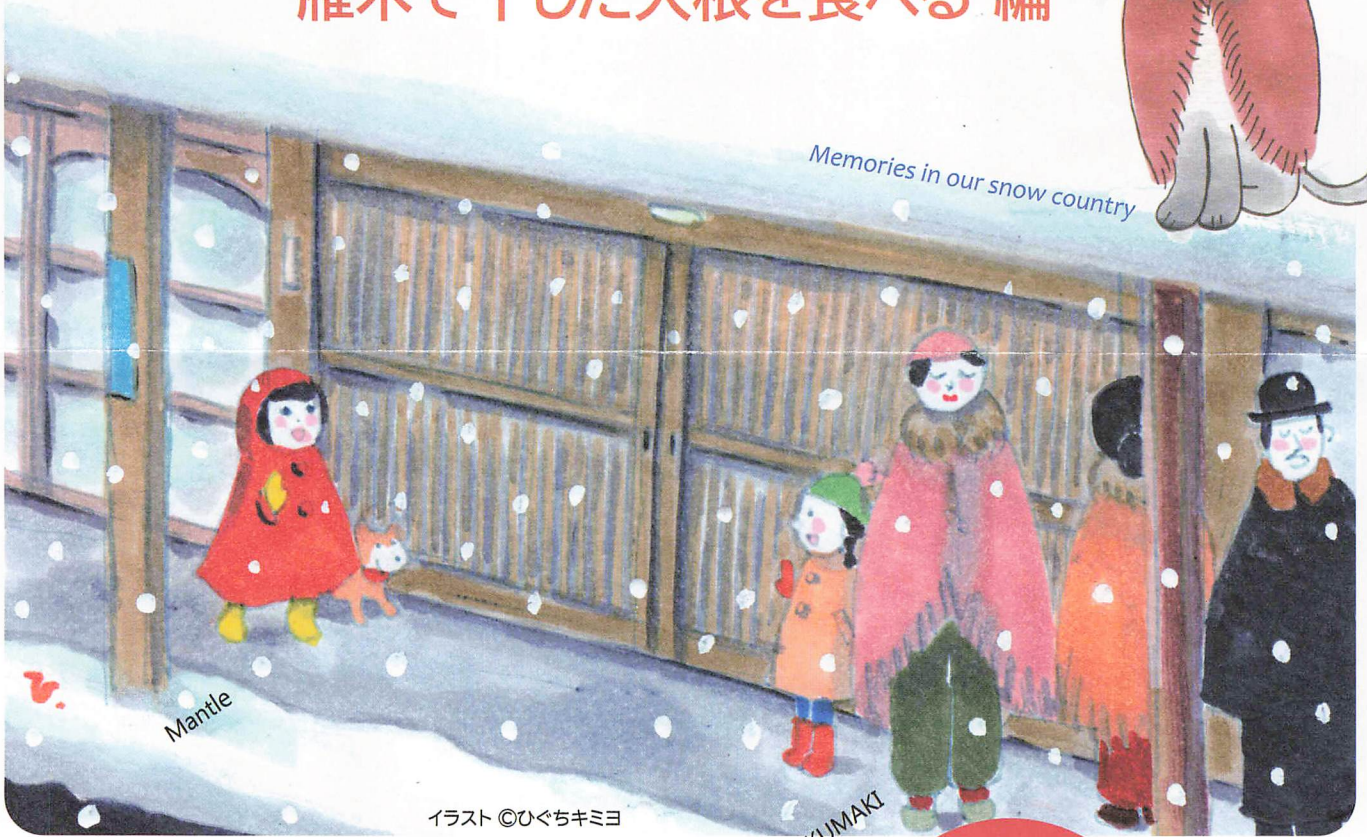
イラスト ©ひぐちキミヨ

日時: 令和8年2月14日(土) 午前10時 受付開始 午前10時半 あわゆき道中に出発! 受付: 高田小町(貸出用角巻・とんびを選ぶ) 参加費: おひとり 1,000円