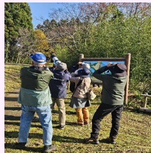
写真: 観察会の様子