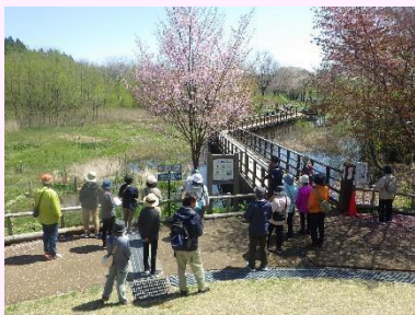
写真: 観察会の様子