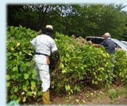
写真: アジサイの剪定