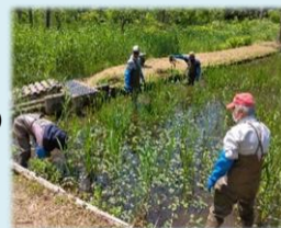
写真: じゅんさい池の清掃