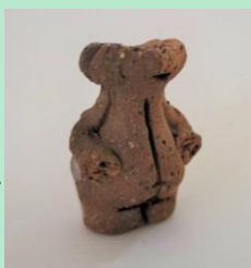
長峰遺跡から出土した土偶（どぐう）