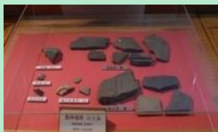
直峰城跡から出土した陶磁器