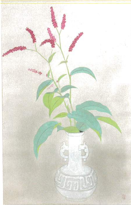
小林古徑《夢》令和3年より寄託