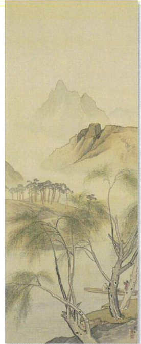
梶田半古《春江》令和3年収蔵