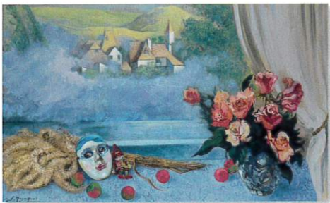
長森聡《霧と仮面のある静物》令和2年収蔵