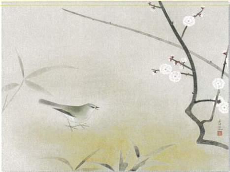
小林古徑《梅にうぐいす》令和4年収蔵