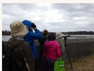
写真:開催時の様子