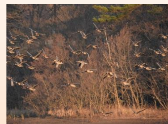
冬鳥 (マガンの群れ)