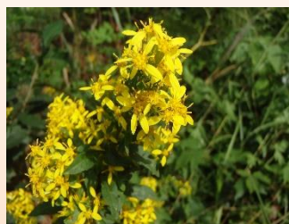
アキノキリンソウ