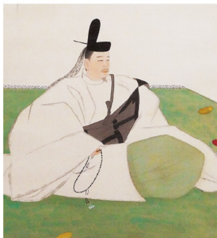
重盛 軸 部分