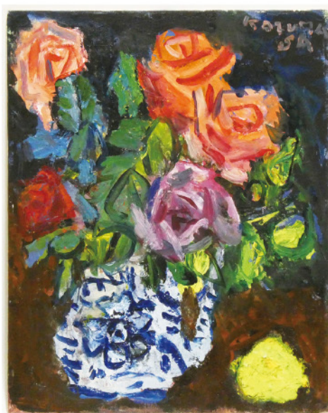
中川一政 薔薇 油彩 6号