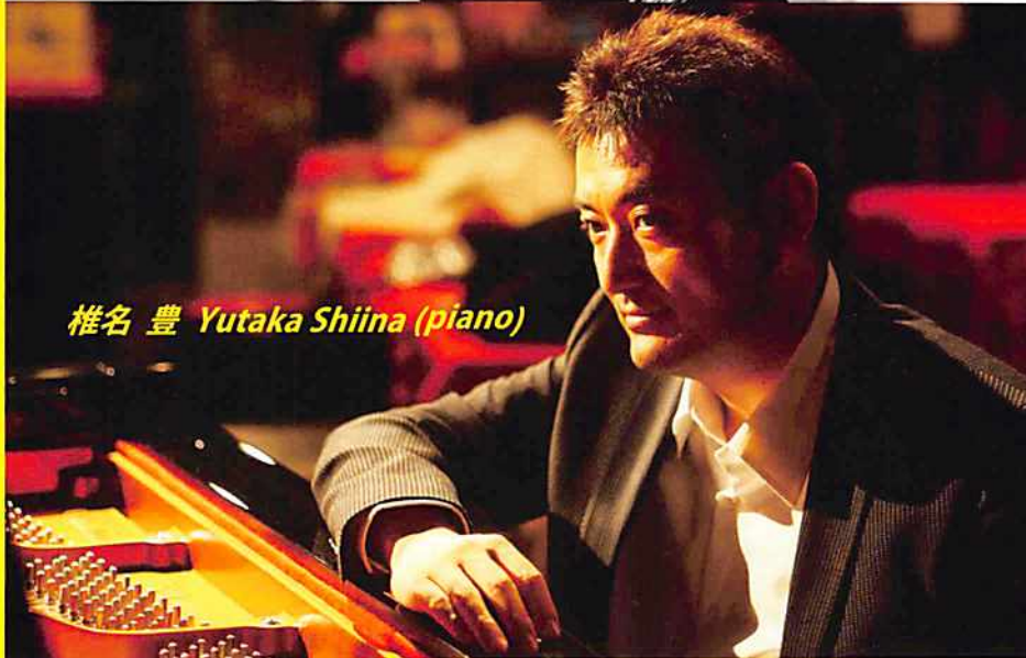
椎名 豊 Yutaka Shiina (piano)