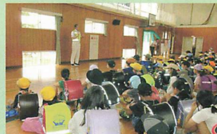
子どもたちに防犯講話で呼びかけ