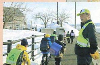
子供の見守り活動は私のライフワーク