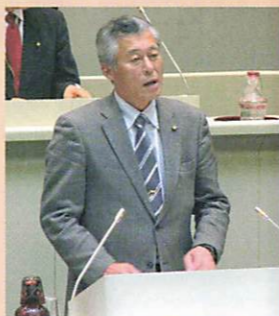
一般質問は毎回実施!