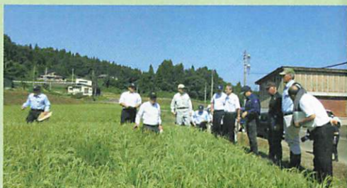
農作物被害調査に参加