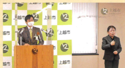
市長の記者会見時での手話通訳

『手話』は一つの『ことば』であることを理解し、コミュニケーション手段として使用していることを知って、差別することなく、お互いを認め合う目的の条例です。