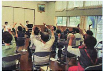
地域スポーツ推進による健康増進や地域医療