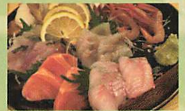
地産地消による地域経済好循環の実現

ワクワクしませんか? Aren't you excited? 未来はあなたの手の中にあるのです! The future is in your hands!