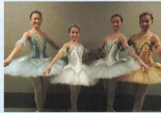
誰もが輝ける芸術文化イベント