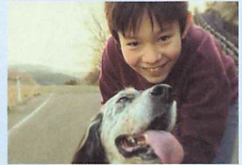
人と動物に優しい共存社会