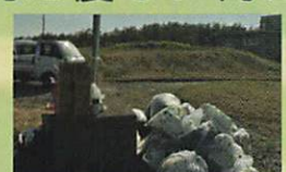
消費者や企業の意識啓発や環境保全活動推進