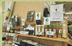
「メイドイン上越」推進による地域産業活性化