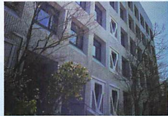
多様性社会に即した行政サービス