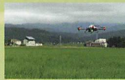
スマート農業の更なる充実や農産物の付加価値向上