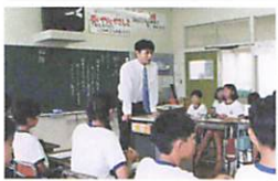
教員時代のひとコマ