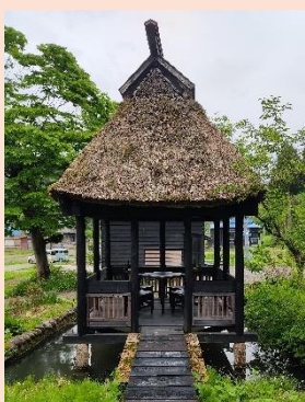
テラス席はペットもOK