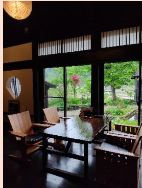
ゲストシェフによる特別メニュー