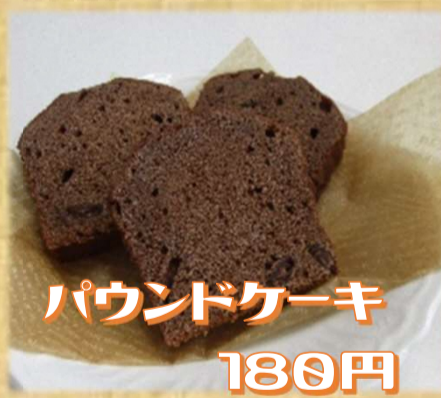
パウンドケーキ 180円

★お支払いは現金のみとなります。ご了承ください。 マイバックの持参にご協力お願いいたします。