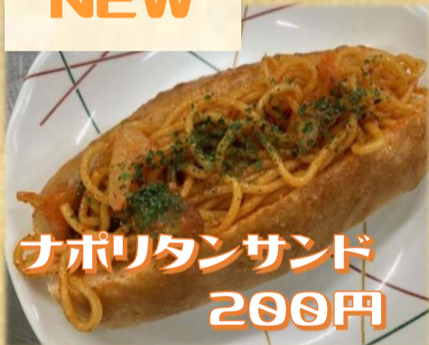
ナポリタンサンド 200円