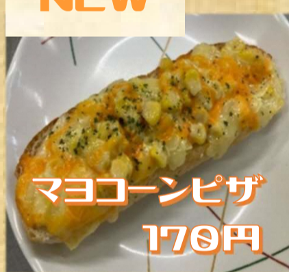
マヨコーンピザ 170円