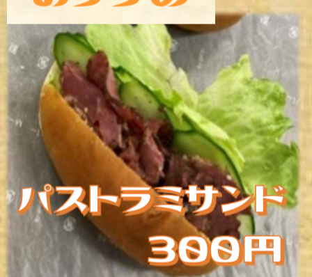
パストラミサンド 300円