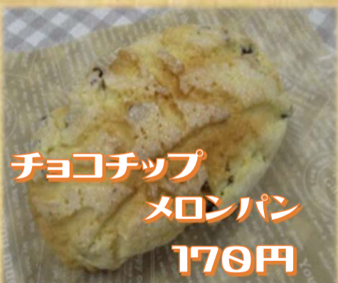
チョコチップ メロンパン 170円