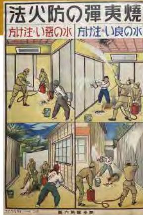
焼夷弾の防火法を伝えるポスター