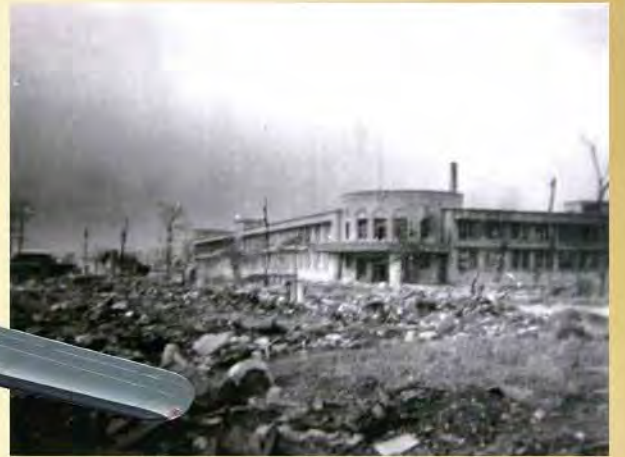
戦災後の長岡赤十字病院