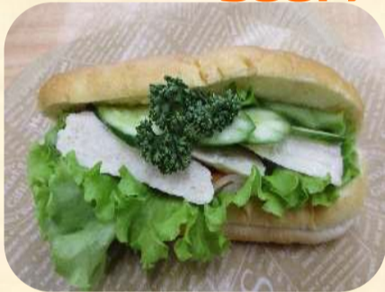
チキンパンミー 300円