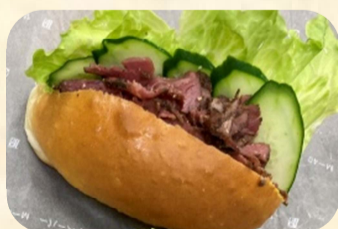
パストラミサンド 300円