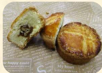
ガレット・ブルトンヌ 200円