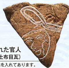
布目瓦に表現された官人 (下山屋敷遺跡出土布目瓦)

国府サミットとNHK大河ドラマ『光る君へ』にちなみ、市内の遺跡の出土品や写真パネルなどを通じ、奈良~平安時代の上越を紹介します。