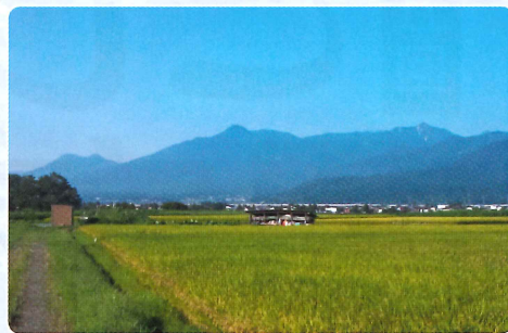
越後国府の推定地 三郷地区