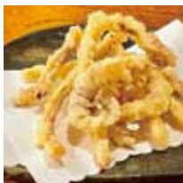
■すりみ屋 「壽士の味 するてん」 「いか風鈴」※