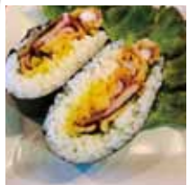
■ステーキダイニングプラン 「するてんのおにぎらず」※