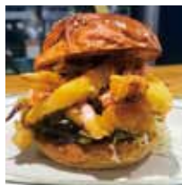
■バーガーカフェ&グリル PICCOLO 「するてんバーガー」※