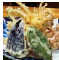
■肴や活等 「一汐スルメと野菜の爆弾揚げ」