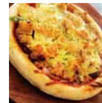
■ぶらんカフェ 「するてんピザ~自家製煮込みマトソース」※ ※印は2025年1月25日イベント限定メニューです