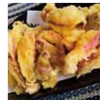
■四かつ 「するてん・カレー風味」※