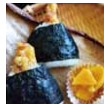
■豚作別館 「するてんむす(竹皮包み)」 要予約