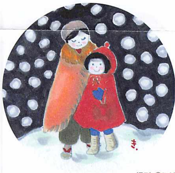
イラスト ©ひぐちキミヨ