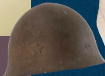
鉄カブト (当館所蔵)