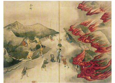
地震誌鑑 個人蔵