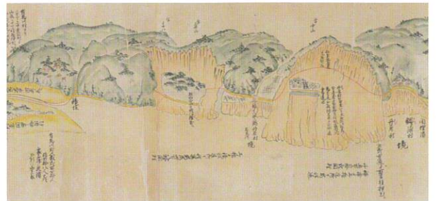
越後国頸城郡高田領往還破損所絵図