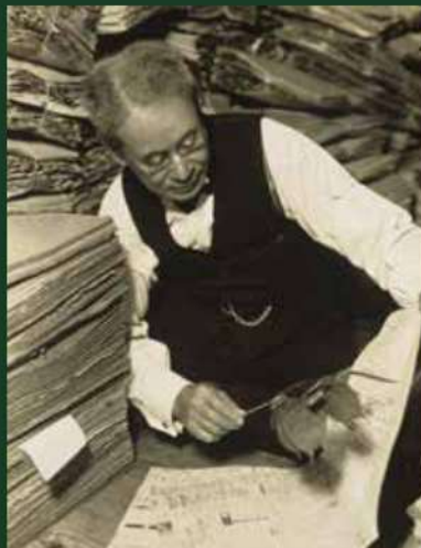
自宅の標本室で