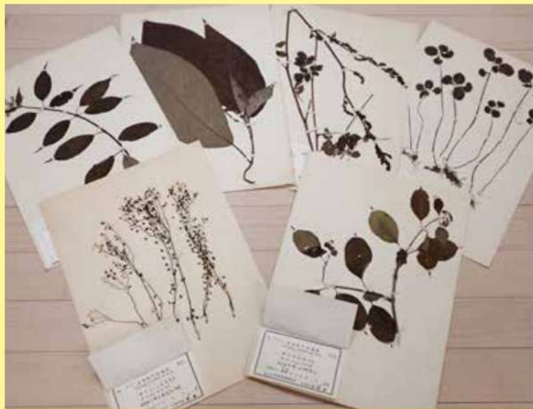
鑑定者 理博牧野富太郎 植物標本 (当館所蔵)

日本で見られる1500種類余りの植物の「名付け親」、牧野富太郎博士。日本のすべての植物を知りたいという夢と、ただただ「植物が好き」という純粋な気持ちを原動力に、日本の近代植物学の基礎を築くとともに、生涯、植物を記録する地道な活動を続けました。